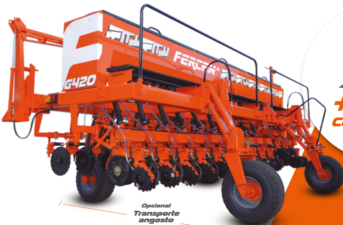
Opcional Transporte angosto 3,50 m