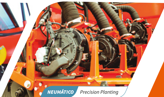
NEUMÁTICO Precision Planting