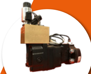
Motor hidráulico para siembra/fertilización variable