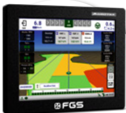
Monitor de siembra