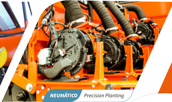
NEUMÁTICO Precision Planting