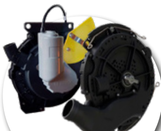
Transmisión eléctrica para siembra